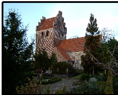
Kirke Værløse Kirke